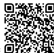
QR-Code: Alle Themen des Monats: